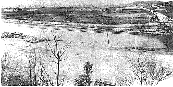
図2 疏水南側から岡崎を見る (1893年頃)