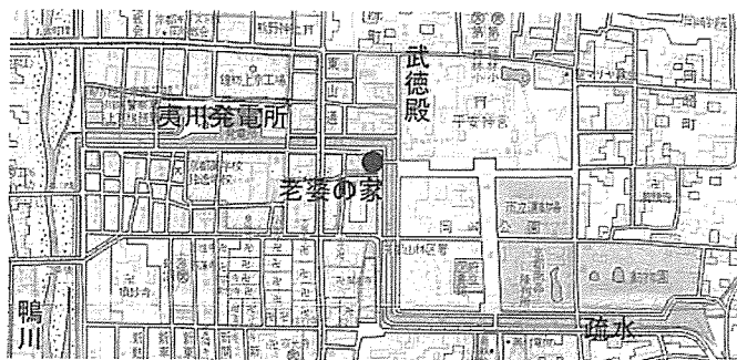
図4 老婆の家の位置 (地図は1915年のもの (9) )

疏水工事を始めた府知事の名前は誤っているものの、作品はたしかに岡崎と疏水の歴史を背景としてふまえている。それは前節で確認したように、大がかりで華やいだ近代京都の公の歴史であり、オモテの景観である。