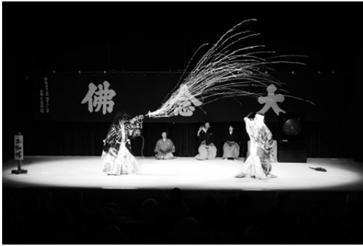
写真1 壬生大念仏狂言 土蜘蛛