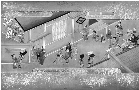
図2 佛教大学附属図書館蔵「十二月あそび 九月」(江戸時代)

七夕は星を祀る日だといひ、琴座のベガが織姫(織女星)、鷲座のアルタイルが彦星(牽牛星)の二星の逢瀬を祝い、中国で「乞巧奠」(きっこうでん)という行事が催されるようになった。織姫にあやかり機織りの技が上手くなるように、ひいては様々な手習いごとの上達を願う。「乞巧奠」が奈良時代の遣唐使によって日本に伝わると、宮中行事として取り入れられるようになった。宮中行事を伝承する京都の冷泉家では、今日でも古式の七夕の歌会や乞巧奠が行われている。日本では、盆に先立ち祖霊を迎えるために乙女たちが水辺の機屋にこもって穢れを祓い、機を織る行事が行われていた。棚を作って機を織ることから「棚機」(たなばた)といひ、機を織る乙女を「棚機女」 たなばたつめ と称した。やがてこの行事と乞巧奠が交じり合い、現在の七夕の行事が形成されていった。元は7月7日の夕方の意である「七夕(しちせき)」とよばれていたものが、棚機にちなんで「七夕(たなばた)」という読み方に変化したものと思われる。なお七夕には短冊に願ひごとを書いて下げる慣習がある。五色の短冊は、中国の陰陽五行説にちなんで「青、赤、黄、白、黒」の五色からきている。また、この日は索餅 さつぱい という餅を食べることが習わしとされていた。