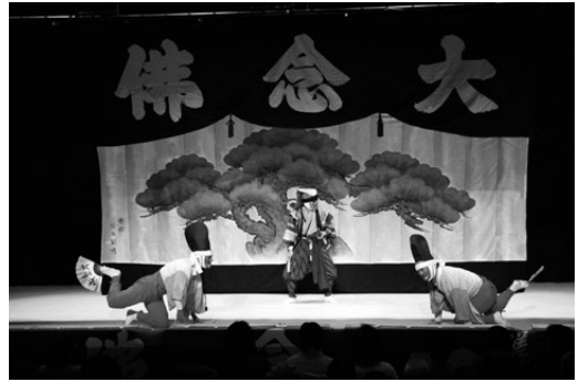
写真2 千本ゑんま堂大念仏狂言 二人名

ある。いずれもかつての大念仏会にともなった乱行念仏が芸能化したもので、本来は仏教の教えに根ざした信仰行事であった。3つの大念仏狂言のうち、ゑんま堂狂言以外はパントマイム、すなわち無言劇であり、ゑんま堂狂言にのみセリフが伝えられている。また壬生大念仏狂言を除いて、他は後継者不足によって昭和30年代以降中絶状態となっていたが、その後次々と復興をとげ、現在では壬生の分流とされる「神泉苑大念仏狂言」を加えて、四大念仏狂言として演じられている。