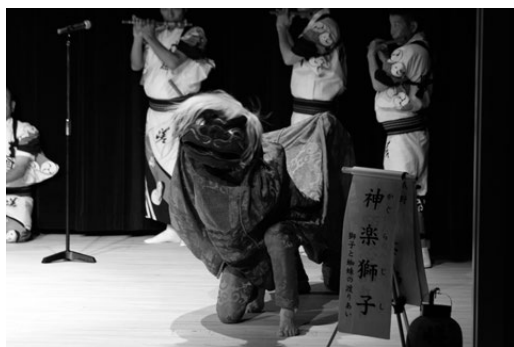
写真5 嵯峨野六斎念仏 神楽獅子