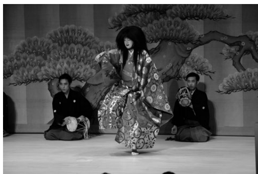
写真7 能楽 菊慈童