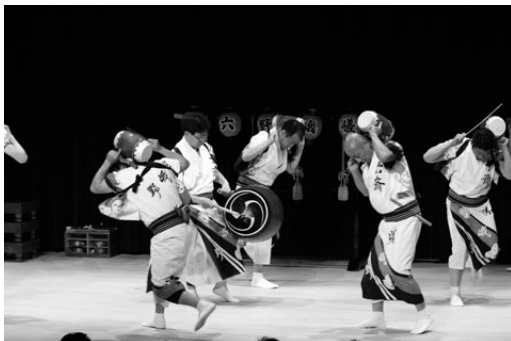
写真4 嵯峨野六齋念仏 四段たぐり

世・南区吉祥院・下京区中堂寺・中京区壬生・中京区千本・北区西賀茂西方寺・北区小山郷・西京区桂・右京区西院・右京区梅津・右京区嵯峨野・右京区水尾・右京区西京極(今は演じておらず))。このうち、上鳥羽・西賀茂・西京極・水尾などを除いた大半の六齋念仏は、すべて芸能六齋である。京都の六齋念仏講中がなぜ早くから芸能的要素を取り入れていったかについては、例えば講中が盂蘭盆に各地を回って布