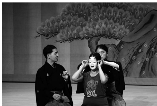
写真8 能のワークショップ 面付け体験

めば災厄から逃れられるだろう」と述べた。桓景がいわれたとおりにすると災厄が消えたという伝説に由来するものである。