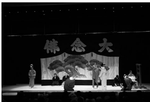
写真3 嵯峨大念仏狂言 釈迦如来

ていないものもあるため、現行では20演目である。それらは、たとえば〈愛宕詣〉・〈花盗人〉・〈大原女〉などの「ヤワラカモン」と、〈羅生門〉・〈土蜘蛛〉・〈大江山〉などの「カタモン」の2種に分けられ、だいたい交互に演じられることが多い。「ヤワラカモン」とは狂言仕立ての曲を、「カタモン」とは能楽仕立ての曲を指している。