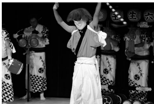
写真6 壬生六斎 棒振り

施を集めるようになると、必然的に信仰的要素以外に「人に見せる」、あるいは「人を驚かせる」必要が生まれ、特にそのような講中が複数あるときは、当然それらの競争が激化することによって、芸能化が一層進むという結果をもたらしたものと考えられる。